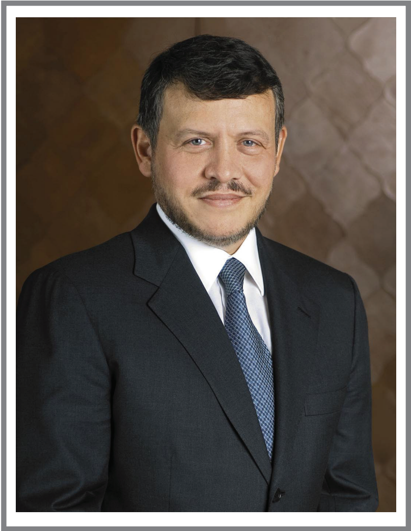
حضرة صاحب الجلالة الملك عبد الله الثاني ابن الحسين المعظم