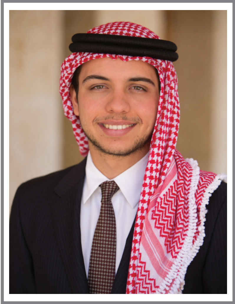
حضرة صاحب السمو الملكي الأمير حسين بن عبد الله الثاني ولي العهد