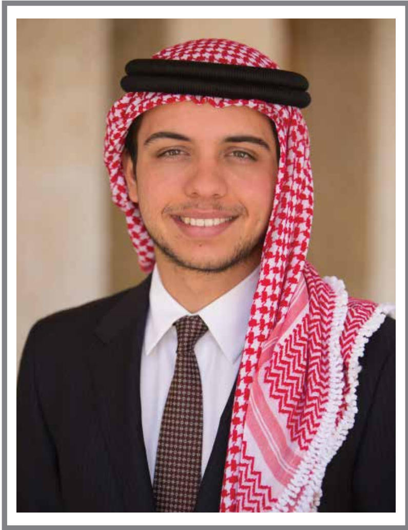
حضرة صاحب السمو الملكي الأمير حسين بن عبد الله الثاني ولي العهد